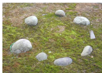
山越遺跡の一部を保存

本校の敷地内には、山越遺跡という縄文時代から奈良・平安時代にかけての集落跡がありました。発掘により、平地住居跡や竪穴住居跡が確認されました。出土品として、石器や縄文式土器、土偶、耳飾りがありました。