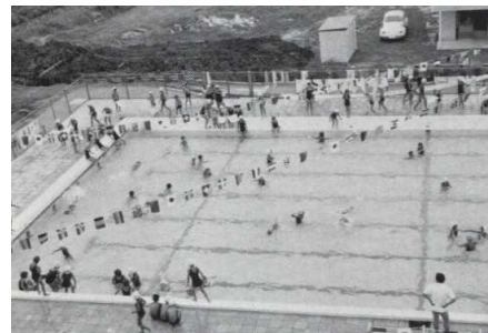
プール ※万国旗が張ってありま