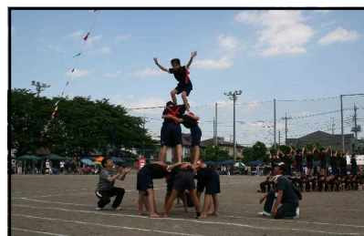
5・6年生の表現種目 「組体ソーラン 2017」