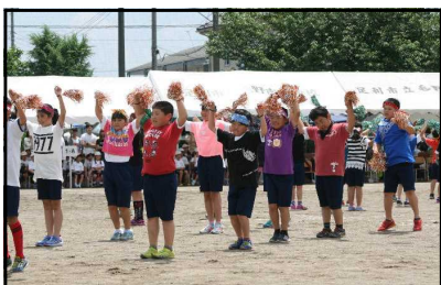
3・4年生の表現種目 「New☆GENERATIONS」