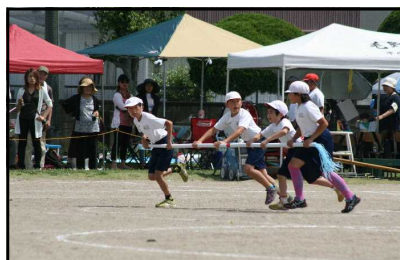
3・4年生の団体種目 「毛南タイフーン 2017」