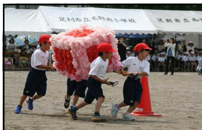
1・2年生の団体種目 「おみこし ワッショイ！」