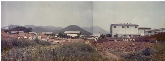
校地予定地内で見つかった山越遺跡の発掘現場

本校は、昭和53年4月に開校されて、今年度で創立40周年を迎えました。創立からこれまでのエピソードやあゆみを何回かに分けてお伝えします。