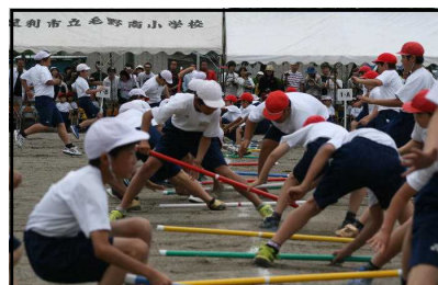
5・6年生の団体種目 「竹取物語」