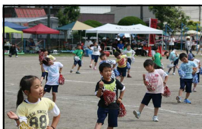
1・2年生の表現種目 「めちやめちやイケてるほくらのダンス」