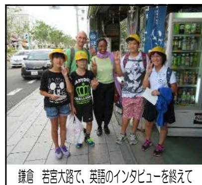
鎌倉 若宮大路上で、英語のインタビューを終えて

2日間とも、きちんと時間を守ったり、互いを助け合ったりするなど、これまで学校の中で学んだことをしっかりと実践出来ました。また、歴史に触れたり、自分の将来を考えたりする中で、多くの学びあり、とても素晴らしい修学旅行となりました。