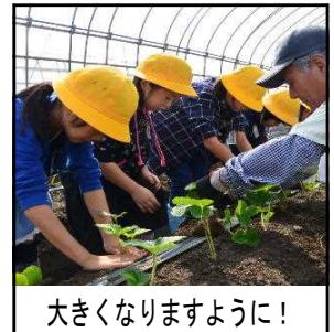
大きくなりますように！