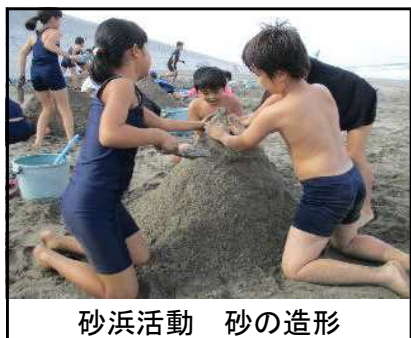
砂浜活動 砂の造形

9月4日(月)～6日(水)の3日間、5年生が、茨城県銚田市にある「とちぎ海浜自然の家」で、宿泊学習を行いました。