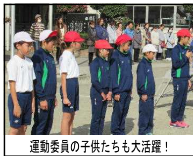
運動委員の子供たちも大活躍！