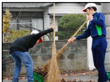
協力して落ち葉掃き

この時期の恒例となりました6年生の落ち葉掃きが、始まりました。この活動は、長年お世話になった学校に対し、感謝の気持ちを込めて、朝の落ち葉掃きボランティアをしてくれています。