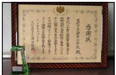
感謝状と記念品(クリスタルトロフィー)

これからも、子供たちに対しての「租税教室」の開催など租税教育を充実させ、税の大切さを指導していききたいと思います。