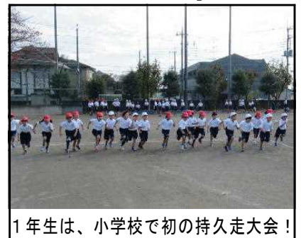
1年生は、小学校で初の持久走大会！

大会後の現在でも、たくさんの子供たちが、朝早めに登校し、元気に校庭を走る姿があります。