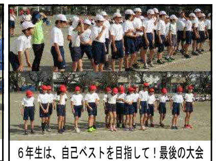
6年生は、自己ベストを目指して！最後の大会