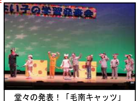
堂々の発表！「毛南キャッツ」