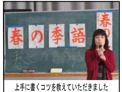
上手に書くコツを教えてくださいました