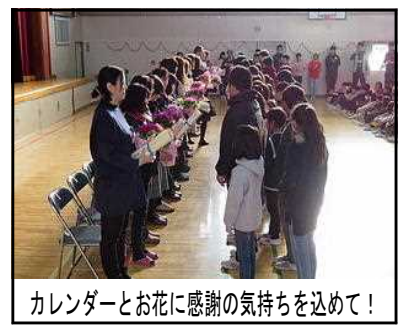
カレンダーとお花に感謝の気持ちを込めて!