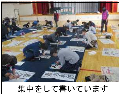
集中をして書いています

今年で16年目となる本校ならではの特色ある行事で、3年生から6年生の子供たちが体育館に集まり、書き初めを行いました。各学年の課題には、皇居・宮殿で行われる「歌会始」のお題に倣い、今年は「語」の一文字が入りました。教室で行う書写の授業とは異なり、広い体育館で張り詰めた雰囲気の中で、心を落ち着かせながら一文字一文字気持ちを込めて書いていました。このような伝統ある行事が開催できることに心から感謝いたします。