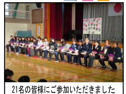
21名の皆様にご参加いただきました