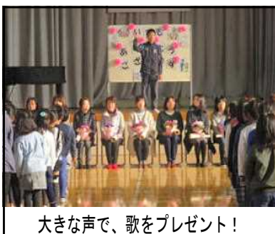
大きな声で、歌をプレゼント!

また、自分の生活は、たくさんの人に支えられているという意識も持たせたいと思います。